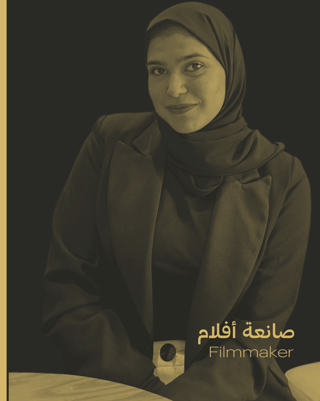
صانعة أفلام Filmmaker